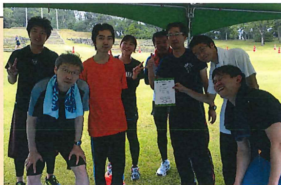
(走り終えての満足感...いっぱい!)

今後も地域の諸行事に積極的に参加し、「河北中央病院」の名を広めてゆきたいと思っています。