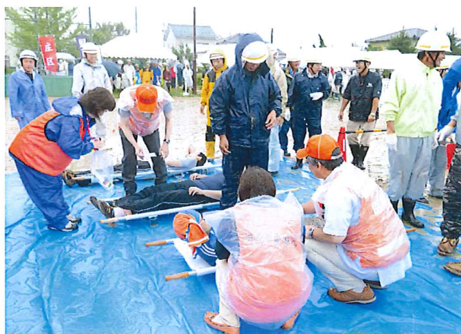
（次々と搬送される負傷者をテキパキとトリアージ）

H27年11月19日（木）午後 トリアージ訓練 H28年3月17日（木）午後 火災部分訓練