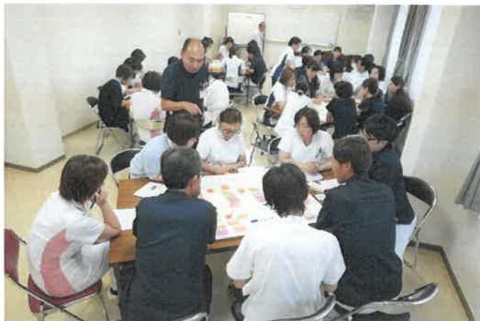
（これからも職員1人ひとりにとって より良い病院を目指します！）

病院で働いている職員が楽しく働くことで病院の雰囲気も変わります。これからも職員一同今以上に医療だけでなく色々な場面において質の高い病院を目指します。