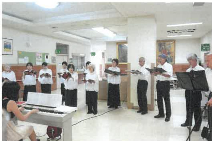
（今年も素晴らしいハーモニーでした 来年もぜひ開催をお願いします！！）

あっという間の時間ではありましたが、「アルビレオ」の皆さんの素敵なハーモニーに酔いしれたひと時でした。今回、お越しになれなかった方は、ぜひ次の機会にお越しください。