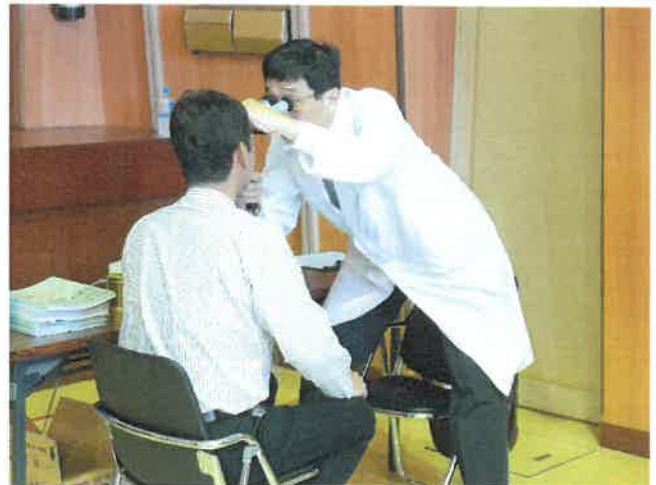
（緑内障検査を行っている様子）

河北中央病院は、今年も10月16（日）、津幡町福祉センターにて行われる健康祭りに参加いたします。今年は糖尿病フェアを行い、寸劇など準備しております。気になります方は、ぜひ、お越しください。