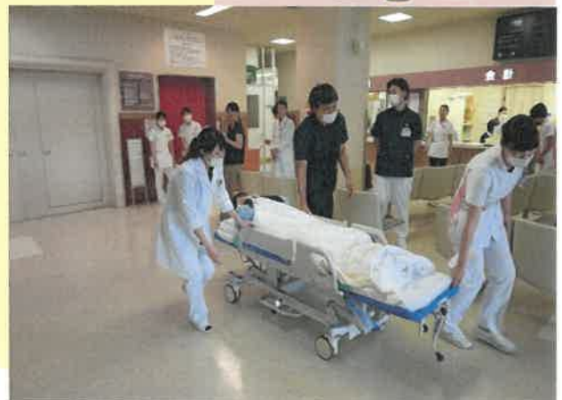
(患者さまを搬送する訓練)