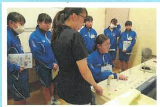
(X線撮影の模擬体験中！慎重に操作)