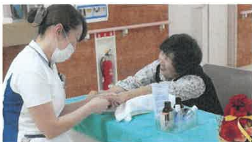
(ハンドマッサージって、気持ちいい〜♥)