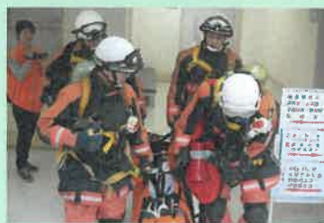
津幡町消防本部と合同で行う「防災防衛訓練」

その他の活動として、病院での火災、地震、その他の災害による被害発生時の適切な対応に向けた消防訓練を行い、万が一の震災等に備えています。これらの取り組みにより、職員の防災意識を高めるとともに、患者さまや来院の皆さまの安全を守っていきます。