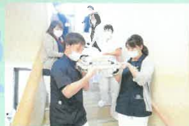
患者さまを安全に避難させる「火災訓練」