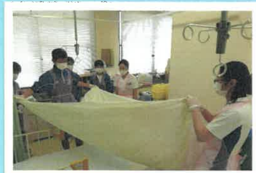
(動いてもズれないベッドメイキングを伝授！家庭でも役立つね★)

5月8日～10日の3日間、津幡南中の生徒さん14人が職場体験に訪れました。病院の様々な仕事を体験しました。おつかれさまでした！