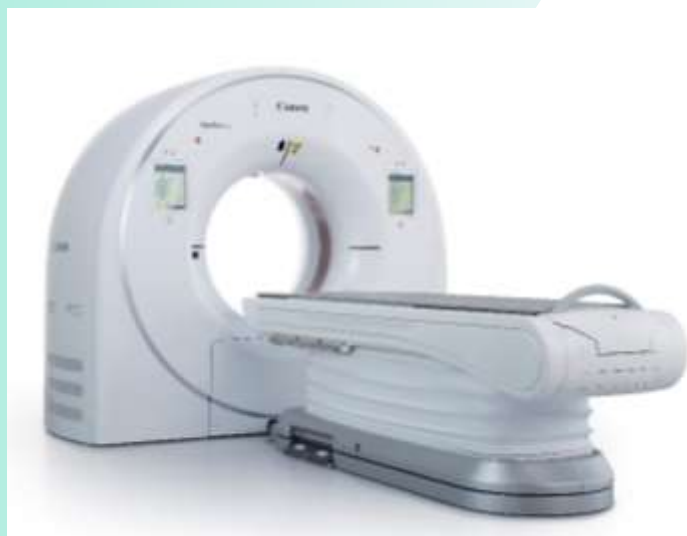
「Aquilion serve」(キャノンメディカルシステムズ株式会社製)

患者さんにとっては、被ばく線量が大幅に低減し、息止め等の負担が軽くなりました。また、ガントリ（患者様が入って撮影するところ）の開口径は 10 cmほど広くなり、閉塞感が低減され、撮影時には、ゆとりをもって手を挙げていただけます。