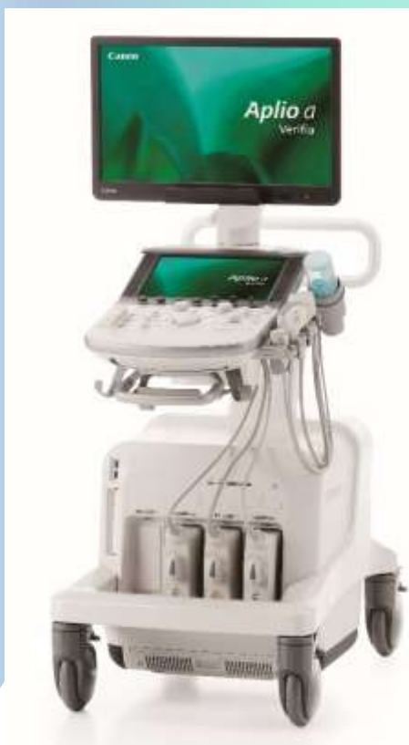
「Aplio a / Verifia」(キャノンメディカルシステムズ株式会社製)

今回導入した超音波装置は、画像が格段にきれいになり、肝硬度測定ができるようになりました。肝硬度測定は肝臓における組織の硬さを評価する検査です。慢性肝炎や進行した脂肪肝では肝組織が徐々に硬くなり線維化します。線維化がさらに進行すると肝硬変になります。これまで、肝臓の硬さを調べる検査は肝臓に直接針を刺して組織を採取して調べる肝生検が行われてきましたが、当院ではシェアウェーブと呼ばれる手法を用いて患者様に負担なく肝硬度測定を行えるようになりました。