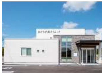
院内はバリアフリー設計です。駐車場も広く、ご利用いただきやすい環境を整えております。

“健康長寿”が謳われる高齢化社会では、生活習慣病の罹患率が高く、開業後一貫してそういった患者様を中心に診療を行なわせていただき、さらには在宅診療/訪問診療により来院できない方々にも医療が行き届くように、「Support for your Healthcare」を目標に、多くの患者様の健康増進、健康管理にお役に立ちたいと願っております。