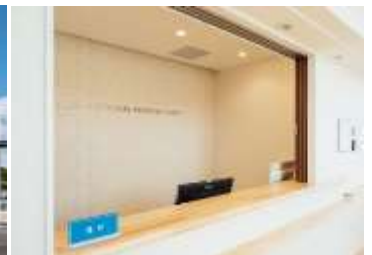
待合室では落ち着いてゆったりとお過ごしいただけます。